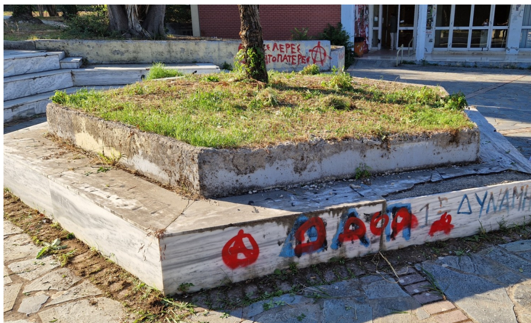
ΕΙΚΟΝΑ 6: ΕΠΙΣΚΕΥΗ ΠΟΛΥΓΩΝΙΚΟΥ ΑΙΘΡΙΟΥ

Στην υπηρεσία προβλέπεται και η καθαίρεση-αποξηλώση-μεταφορά εκτός του Πανεπιστημίου των επενδύσεων που θα αντικατασταθούν