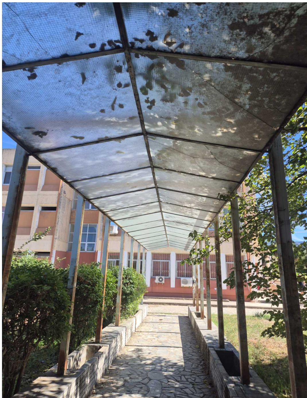
ΕΙΚΟΝΑ 4: ΕΠΙΣΚΕΥΗ ΜΕΤΑΛΛΙΚΟΥ ΣΤΕΓΑΣΤΡΟΥ

του τζαμιού μετά από θραύση για λόγους ασφαλείας. Επίσης οι κατάλληλες προδιαγραφές κατασκευής και τοποθέτησης θα εξασφαλίζουν την υδατοστεγανότητά τους