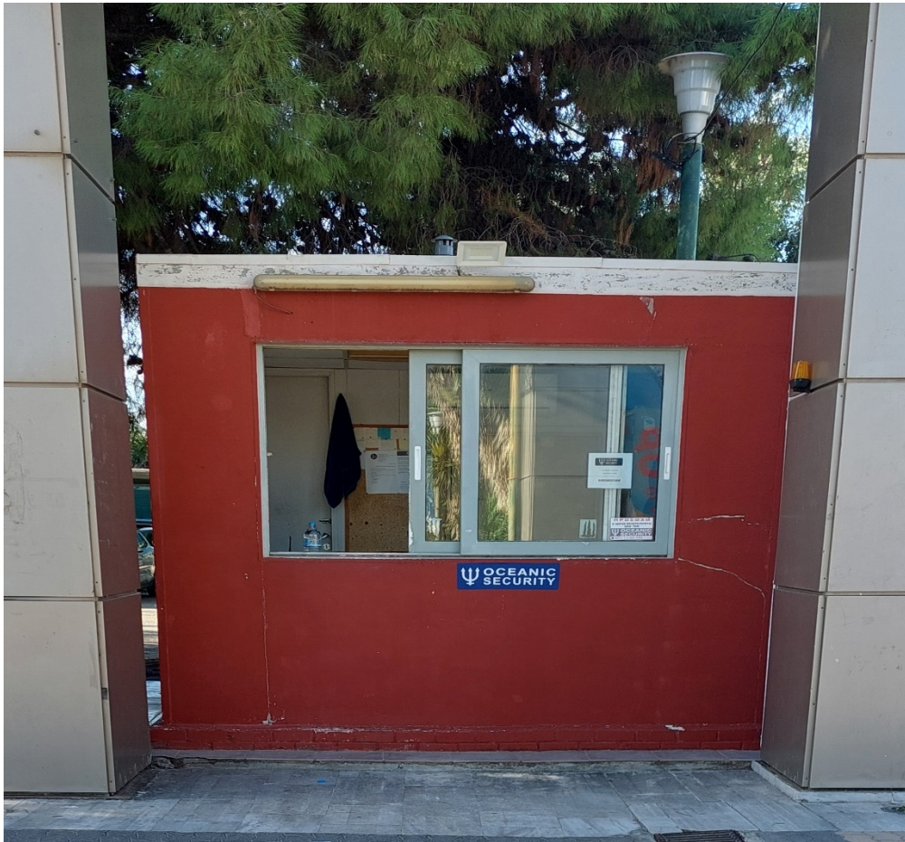
ΕΙΚΟΝΑ 3: ΤΟΠΟΘΕΤΗΣΗ ΝΕΟΥ ΦΥΛΑΚΙΟΥ ΚΕΝΤΡΙΚΗΣ ΕΙΣΟΔΟΥ