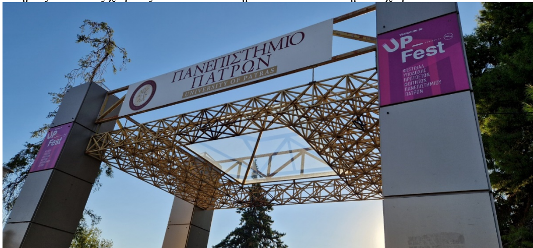
ΕΙΚΟΝΑ 2: ΕΠΙΣΚΕΥΗ ΣΤΕΓΑΣΤΡΟΥ ΚΕΝΤΡΙΚΗΣ ΕΙΣΟΔΟΥ