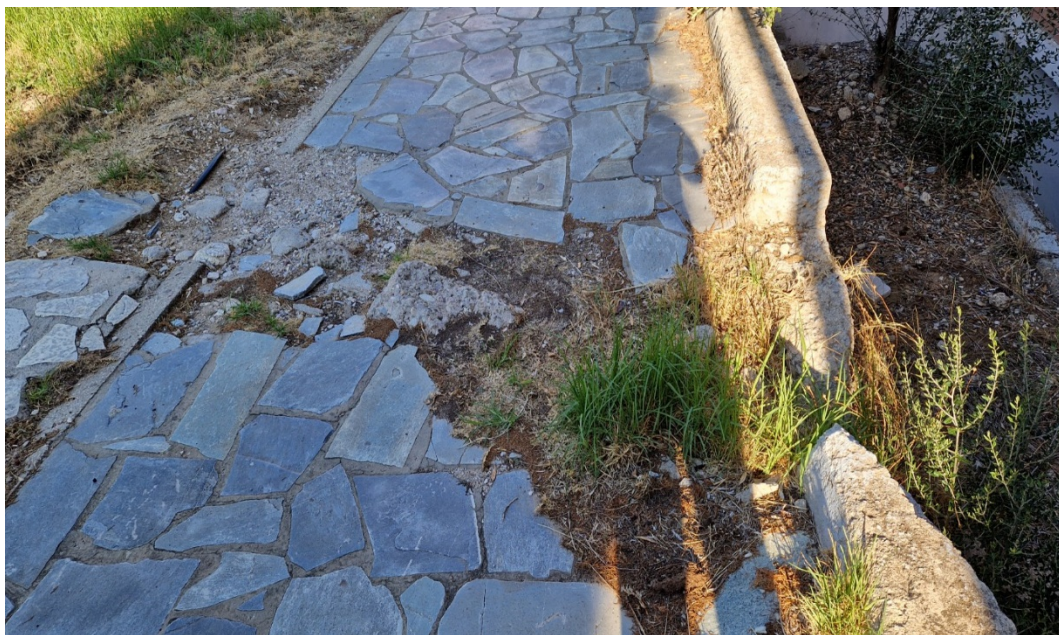
ΕΙΚΟΝΑ 5: ΑΠΟΚΑΤΑΣΤΑΣΗ ΕΠΙΣΤΡΩΣΕΩΝ ΔΑΠΕΔΩΝ

Οι πλάκες που θα χρησιμοποιηθούν για την επίστρωση θα είναι ίδιες με τις υφιστάμενες πλάκες Καρύστου ακανόνιστου μεγέθους και απόχρωσης χρώματος γκρι. Το κάθε σημείο επισκευής αφορά κατ'ελάχιστο επιφάνεια 1 m 2 σύμφωνα με τις υποδείξεις της υπηρεσίας. Κατά την επίστρωση θα ακολουθηθεί το υπάρχον σχέδιο του πλακόστρωτου. Οι τελικές κλίσεις που θα έχει το πλακόστρωτο για την απορροή των ομβρίων υδάτων θα καθοριστούν επιτόπου στο έργο με συνεργασία αναδόχου και επίβλεψης. Επίσης θα επισκευαστεί πλήρως το τμήμα τοιχίου που εμφανίζεται στην εικόνα 5, με τρόπο που αναλυτικά περιγράφεται στη παρ. Ε (προσθηκη τμ τοιχίου).