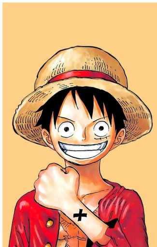
Ο πρωταγωνιστής της σειράς Monkey D.

που θέλουν να αποκτήσουν το One Piece, αλλά και η τεράστια δύναμη του «Ναυτικού», ένα τμήμα της «Παγκόσμιας Κυβέρνησης», μιας δικτατορίας, η οποία α-