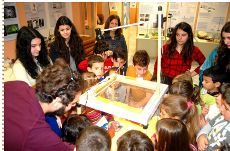
Οι επισκέπτες περιεργάζονται τα εκθέματα του Μουσείου.

Τ ο Μουσείο Επιστημών και Τεχνολογίας αποτελεί έναν ευχάριστο χώρο άτυπης εκπαίδευσης, πειραματισμού, συνεργασίας, απόκτησης γνώσης και εμπειρίας, αλλά και διασκέδασης. Λειτουργεί στον χώρο της Πανεπιστημιούπολης σαν Εργαστήριο της Σχολής Θετικών Επιστημών. Απευθύνεται όμως σε όλη την πανεπιστημιακή κοινότητα, καθώς και