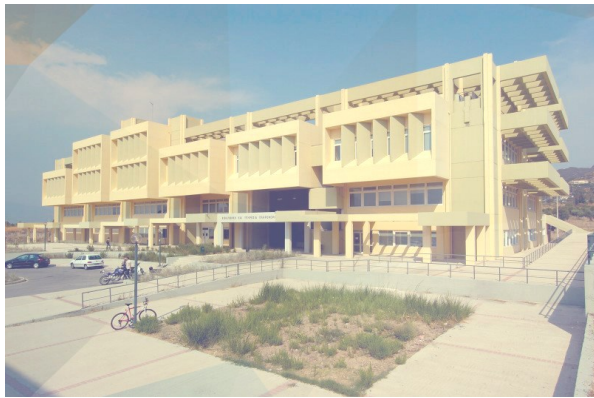
Το κτήριο της ΒΚΠ στην πανεπιστημιούπολη Πατρών