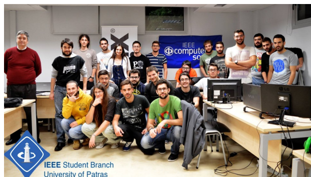
Τα μέλη του τοπικού παραρτήματος του IEEE στην Πάτρα.

Τ α τοπικά παραρτήματα του IEEE (IEEE Student Branches) αποτελούν υποδιαίρεση του IEEE και αυτή την στιγμή απαριθμούνται περίπου 1.150 σε όλο τον κόσμο. Στις αρμοδιότητές τους περιλαμβάνεται η εξοικείωση και η ενημέρωση των φοιτητών για το IEEE και τις δραστηριότητές του. Επιπλέον, αναλαμβάνουν την οργάνωση σεμιναρίων και workshops πάνω σε νέες τεχνολογίες, επισκέψεων σε τεχνολογικά και φοιτητικά συνέδρια, κ.α. και είναι υπεύθυνα για τον προσανατολισμό νέων μελών. Παρέχουν στους προπτυχιακούς και μεταπτυχιακούς φοιτητές που βρίσκονται σε τεχνικά και τεχνολογικά πανεπιστήμια ευκαιρίες για ακαδημαϊκή, τεχνολογική και επαγγελματική εξέλιξη μέσα από τη δράση τους.