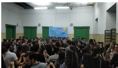
Στιγμιότυπο από τις πολιτιστικές εκδηλώσεις του 2018

Ένα ζεστό καλωσόρισμα στις ομάδες θα βρείτε στο κανάλι Youtube της κινηματογραφικής ομάδας ( https://www.youtube.com/user/KinimatografikoPatra ).