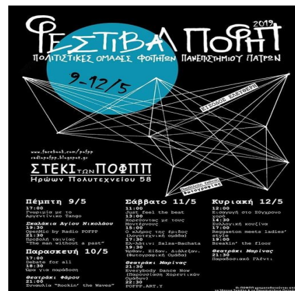
Αφίσα από το φεστιβάλ των πολιτιστικών ομάδων τον Μάιο 2019

Πώς γράφομαι στις ομάδες αυτές και πού συναντιούνται τα μέλη τους; Ξεκινήστε από την ανοικτή ομάδα στο facebook pofpp ( https://www.facebook.com/pofpp/ ). Εκεί θα βρείτε τις ιστοσελίδες και τα fb groups των διάφορων ομάδων. Διαλέξτε την ομάδα που σας ενδιαφέρει. Γράψτε στους υπεύθυνους και εκδηλώστε τη διάθεση συμμετοχής σας. Στα μέσα Οκτώβρη, που οι παλιοί τελειώνουν με τις υποχρεώσεις των εξετάσεων, οι ομάδες κάνουν τις πρώτες συναντήσεις