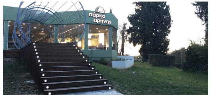
Το Πάρκο της Ειρήνης, το κεντρικό σημείο συνάντησης της Πανεπιστημιούπολης, κάποιες ώρες εξαιρετικά θορυβώδες. Τα καλοκαίρια, τραπεζάκια έξω με θέα τη γέφυρα.

Για ένα σάντουιτς ή έναν καφέ υπάρχει η λύση των κυλικείων (Ιατρικής, Θετικών Επιστημών, Πολιτικών Μηχανικών, Μηχανικών Υπολογιστών), της στάσης κοντά την Πρυτανεία που έχει επώνυμο καφέ στα όρθια, καθώς και του Πάρκου της Ειρήνης, του κεντρικού σημείου συνάντησης στο Πανεπιστήμιο. Για φαγητό υπάρχει η λύση του Πάρκου της Ειρήνης που έχει ένα φτηνό και καλό εστιατόριο: με 5 ευρώ μπορείτε να φάτε μαγειρευτό φαγητό, σχεδόν σαν στο σπίτι σας. Επίσης, υπάρχει η λύση του Εστιατορίου της Φοιτητικής Εστίας. Είναι ένα μεγάλο εστιατόριο όπου κάθε μέρα χιλιάδες φοιτητές παίρνουν πρωινό, μεσημεριανό ή ακόμη και βραδινό. Μάλιστα την Πέμπτη, τη μέρα που έχει το καλύτερο πιάτο της εβδομάδας, η αναμονή στην ουρά μπορεί να κρατήσει αρκετά. Εδώ όμως χρειάζεται είτε να βγάλετε την κάρτα σίτισης, αν δικαιούστε, ή να αγοράσετε κουπόνια εβδομαδιαία από την Εστία. Το κόστος: στην