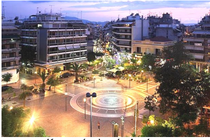
Κεντρική πλατεία Αργίνιο

Ο μεγαλύτερος αριθμός των νέων φοιτητών του Πανεπιστημίου μας γράφεται σε τμήματα που βρίσκονται στην πανεπιστημιούπολη του Ρίου. Πάνω από 6 στους 10 νέους φοιτητές φοιτούν εκεί. Όμως από φέτος πολλοί πρωτοετείς μας θα φοιτούν