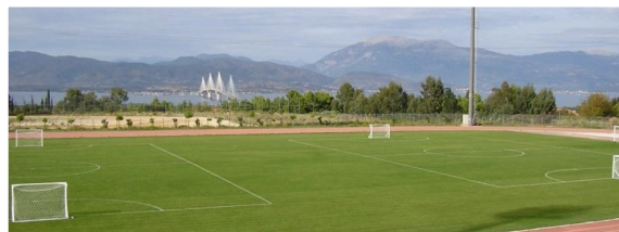
Εικόνες από τα γήπεδα τένις πριν γίνουν οι εργασίες αναδόμησης και το γήπεδο ποδοσφαίρου στον εξωτερικό χώρο.