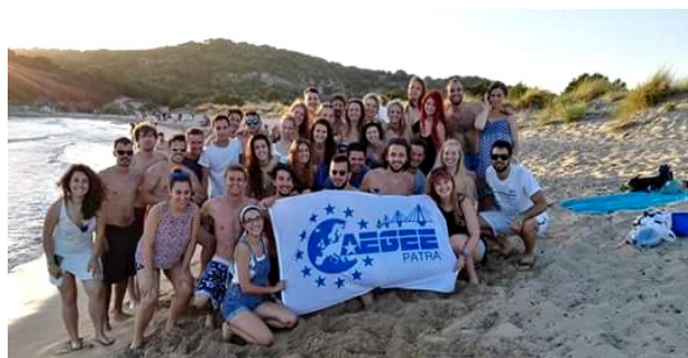
Στην παραλία της Βοϊδοκοιλιάς κατά τη διάρκεια του Summer University 2016.

Η πανευρωπαϊκή μη κερδοσκοπική οργάνωση φοιτητών και νέων όλων των επισημών AEGEE (Association des Etats Generaux des Etudiants de L'Europe – γαλλικό δηλαδή, προφέρεται Αεζέ!) είναι ανεξάρτητη από πολιτικές κατευθύνσεις, και η λειτουργία της βασίζεται στην εθελοντική εργασία των μελών της. Στοχεύει στην προώθηση της ευρωπαϊκής ιδέας και στην αύξηση της κινητικότητας των νέων, δίνοντάς τους ευκαιρίες για ανταλλαγή κουλτούρας και εμπειριών μέσα από τη δημιουργία διαπροσωπικών σχέσεων συνεργασίας και φιλίας μεταξύ των νέων.