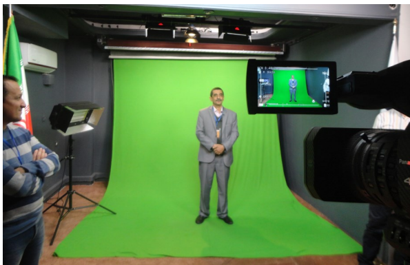
Το video studio του TUMS Virtual School: χρήση πράσινης οθόνης