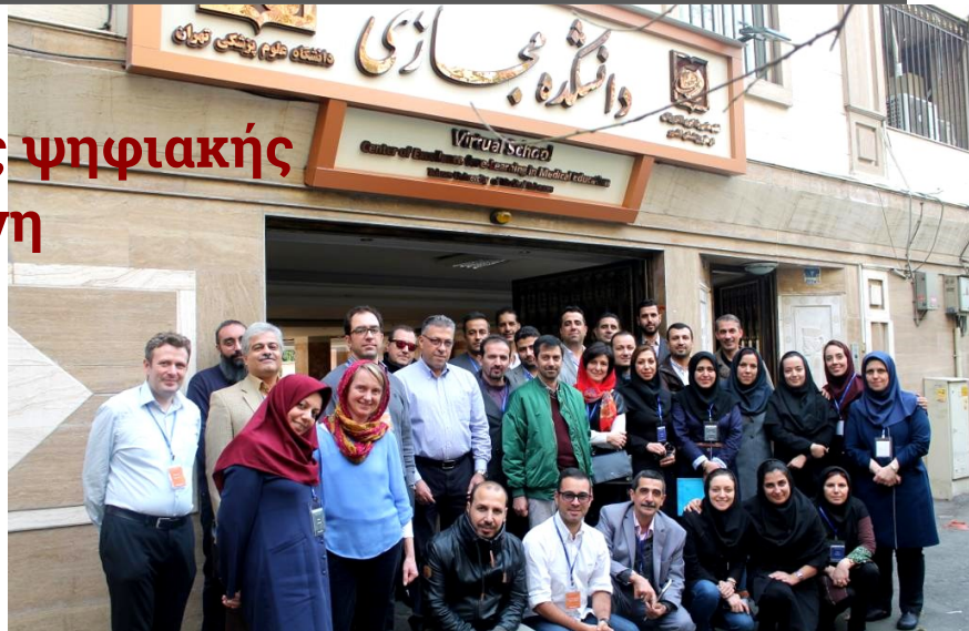
Οι συμμετέχοντες στην TUMSVirtualSchool

Ιδιαίτερο ενδιαφέρον παρουσίασε η εμπειρία του Πανεπιστημίου Ιατρικών Επιστημών της Τεχεράνης, με 11 σχολές που εποπτεύουν 16 νοσοκομεία με 100 κλινικές στην πόλη των σχεδόν 9 εκατομμυρίων κατοίκων. Το TUMS είναι πρωτοπόρο στον τομέα της ψηφιακής μάθησης και έχει ιδρύσει Εικονική Σχολή (Virtual School), η οποία παρέχει μεταπτυχιακές σπουδές (M.Sc. και Ph.D.) σε E-Learning in Medical Education και Educational Technology. Το TUMS χρησιμοποιεί την ψηφιακή εκπαίδευση ως τμήμα της στρατηγικής του για διεθνοποίηση και προσέλκυση ξένων φοιτητών. Το μοντέλο λειτουργίας της Εικονικής Σχολής είναι σίγουρα προοδευτικό