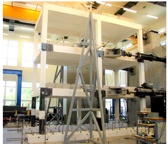
Εικόνα του επισκευασμένου κτιρίου με χρήση ανθρακονημάτων

Η κατασκευή αυτή ανήκει στην κατηγορία των μη-σεισμικά σχεδιασμένων κατασκευών, δηλαδή κατασκευές, οι οποίες σχεδιάστηκαν είτε χωρίς είτε βάσει κανονιστικών διατάξεων πολύ υποδεέστερων αυτών που ισχύουν στην Ελλάδα και διεθνώς, την τελευταία δεκαετία. Η κατασκευή δοκιμάστηκε σε κλίμακα 1:1.5. Το κτίριο, κάτοψης 6.90x3.30m και ύψους 6.0m, κατασκευάστηκε από οπλισμένο σκυρόδεμα και διαθέτει 3 και 2 υποστυλώματα στη μεγάλη και τη μικρή πλευρά, αντίστοιχα, τα οποία πακτώθηκαν στο ισχυρό δάπεδο του εργαστηρίου. Για λόγους σύγκρισης της συμπεριφοράς, η υπερκάλυψη (μάπιση) των οπλισμών σε ορισμένα υποστυλώματα γινόταν με άγκιστρα, ενώ σε άλλα (σε αντίστοιχες θέσεις) οι οπλισμοί ήταν συνεχείς. Στο κτίριο επιβλήθηκε οριζόντια φόρτιση σεισμικού τύπου, μέσω 5 εμβόλων στηριζόμενων στον ισχυρό τοίχο αντίδρασης του εργαστηρίου και υλοποιήθηκε σε δύο φάσεις: μια με το κτίριο όπως κατασκευάστηκε (αρχική κατάσταση) και μια αφότου οι βλάβες, οι οποίες δημιουργήθηκαν κατά την πρώτη δοκιμή επισκευάστηκαν με χρήση ανθρακονημάτων σε μορφή υφάσματος, τα οποία επικολλήθηκαν με ρητίνη σε βάση/κορυφή των υποστυλωμάτων, καθώς και στους κόμβους δοκών-υποστυλωμάτων του ισογείου. Ενδεικτικά αναφέρεται ότι σε σχέση με το κτίριο στην αρχική μορφή του (το οποίο παρουσίασε ρηγματώσεις φερόντων στοιχείων για