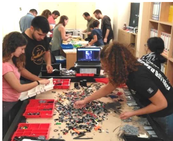
Οι ομάδες Ρομποτικής στο MET εν δράσει

Σε συνεργασία με τα Τμήματα Αγωγής Υγείας της πρωτοβάθμιας και δευτεροβάθμιας εκπαίδευσης, διοργάνωσε Πανελλήνιο διαγωνισμό δημιουργικής γραφής με θέμα τον εθισμό στο διαδίκτυο . Τα παιδιά που συμμετείχαν από όλη την Ελλάδα έγραψαν θεατρικά έργα, παραμύθια, εικονογραφημένες ιστορίες για το θέμα.