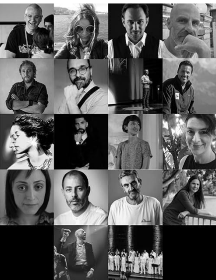
Οι ομιλητές και οι performers.

Κ άθε ιστορική περίοδος διέπεται από διαφορετικές, κάθε κοινωνία αναπτύσσει τις δικές της, κάθε άνθρωπος ή ομάδα ανθρώπων διακρίνεται από συγκεκριμένες. Άλλες αμετάβλητες στον χρόνο, ανθεκτικές και κοινά αποδεκτές. Άλλες μεταλλασσόμενες, ιδιαίτερες ή αμφισβητήσιμες. Ατομικές, κοινωνικές, ανθρωπιστικές, πνευματικές ή άλλες. Το φετινό TEDxPatras συνάντησε και αναμετρήθηκε με τις αξίες. Οι ομιλητές που ήρθαν στην Πάτρα και όλες οι παράλληλες εκδηλώσεις (εργαστήρια, δραστηριότητες, εκθέματα, γαστρονομικές και άλλες εμπειρίες) μας έφεραν πρόσωπο με πρόσωπο το Σάββατο 3 Νοεμβρίου στο Royal Theater με τις «Αξίες» μας.