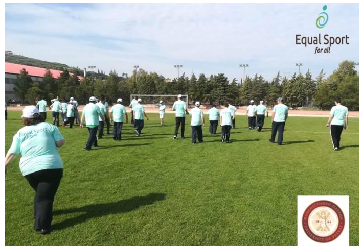
Στιγμιότυπο από το πλαίσιο δράσης ατόμων με ειδικές ανάγκες στις αθλητικές εγκαταστάσεις του Πανεπιστημίου Πατρών.