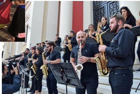
Η Φιλαρμονική Ορχήστρα της Πολυφωνικής Χορωδίας Πάτρας «συνοδεύει» τον περίπατο.