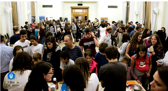
Επιμελητήριο Αχαΐας : Βραδια Ερευνητή 2018

Στο Επιμελητήριο Αχαΐας (Ρ.Φεραίου) την Παρασκευή 28 Σεπτεμβρίου 2018 από τις 6 το απόγευμα ως αργά το βράδυ, έγιναν οι εκδηλώσεις της βραδιάς ερευνητή στην Πάτρα. Η Πάτρα είναι μια από τις 300 Ευρωπαϊκές πόλεις που συμμετείχαν στην εκδήλωση. Το Πανεπιστήμιο Πατρών ήταν συνδιοργανωτής της εκδήλωσης για 13η συνεχόμενη χρονιά. Η εκδήλωση που είναι μια πρωτοβουλία της Ευρωπαϊκής ένωσης, έχει ως στόχο μικροί και μεγάλοι να γνωρίσουν και να αγαπήσουν τον κόσμο της επιστήμης.