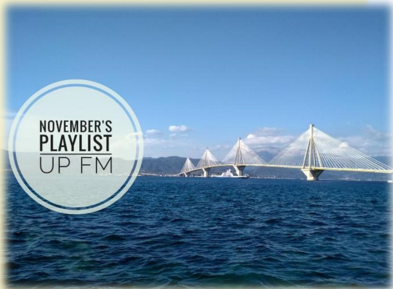
[Μαρία Σκλιά, Ραδιοφωνικός Παραγωγός στον UPFM– Ραδιοφωνικό Σταθμό Πανεπιστημίου Πατρών]