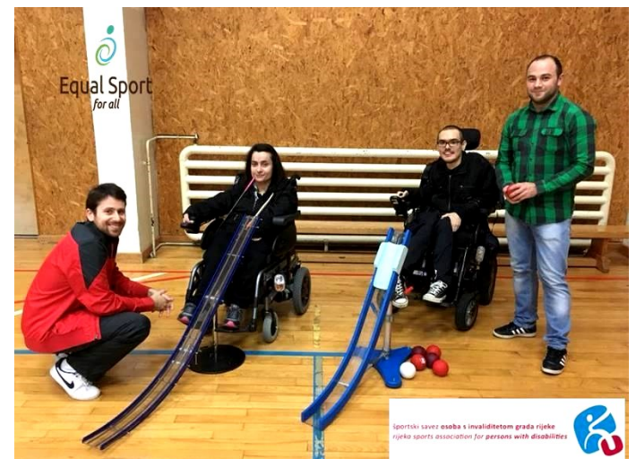
Στιγμιότυπο στο πλαίσιο δράσης από την Αθλητική ένωση Rijeka για άτομα με ειδικές ανάγκες, Κροατία.