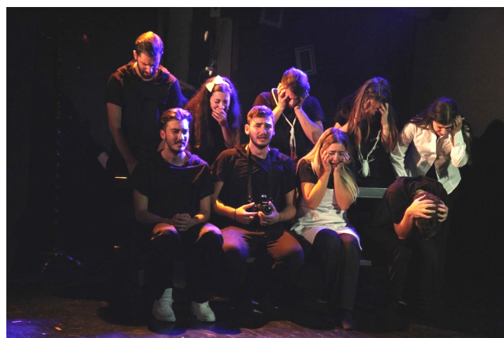
Στιγμιότυπο από την παράσταση