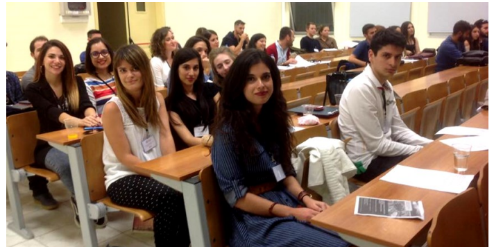
Στιγμιότυπο με τους φοιτητές της κλασικής ειδίκευσης του Πανεπιστημίου Πατρών