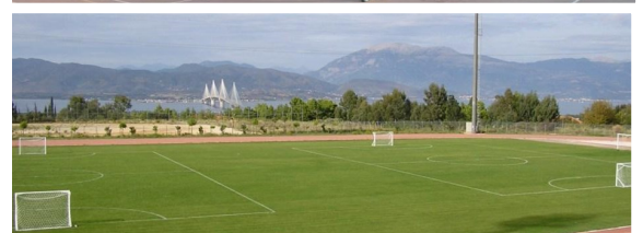
Εικόνα από τα γήπεδα τένις πριν γίνουν οι εργασίες αναδόμησης και το γήπεδο ποδοσφαίρου στον εξωτερικό χώρο.