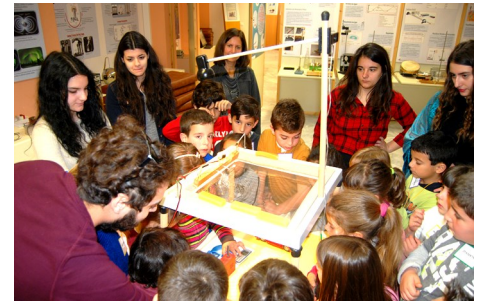
Οι επισκέπτες περιεργάζονται τα εκθέματα του Μουσείου.

Το MET δίνει τη δυνατότητα στους φοιτητές όχι μόνο να επισκεφθούν τις εκθέσεις του και να παρακολουθήσουν τις ποικίλες δραστηριότητές του, αλλά και να συμμετάσχουν στην οργάνωση και υλοποίηση των περιοδικών εκθέσεων, των εκπαιδευτικών δράσεων, των εκδηλώσεων του και όλων των δραστηριοτήτων του μέσω εθελοντισμού και πρακτικής άσκησης.