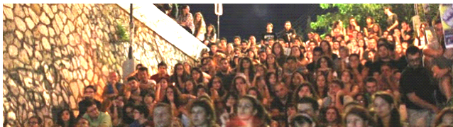
Προβολή ταινίας στα σκαλάκια της οδού Αγ. Νικολάου

Ένα ζεστό καλωσόρισμα στις ομάδες θα βρείτε στο κανάλι Youtube της κινηματογραφικής ομάδας ( https://www.youtube.com/user/KinimatografikoPatra ). Ψάξτε τα βίντεο για τα φεστιβάλ ΠΟΦΠ.