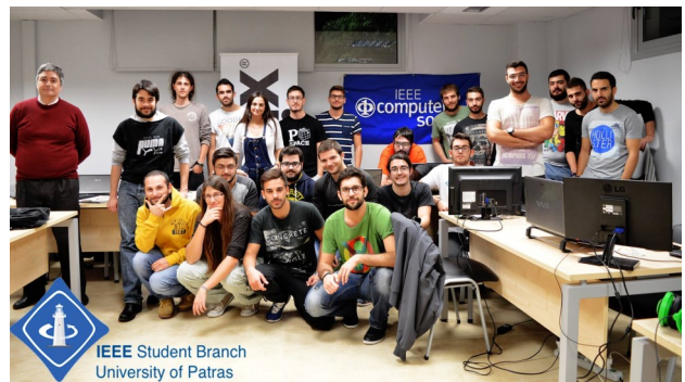
Τα μέλη του τοπικού παραρτήματος του IEEE στην Πάτρα.

Τ α τοπικά παραρτήματα του IEEE (IEEE Student Branches) αποτελούν υποδιαίρεση του IEEE και αυτή την στιγμή αριθμούνται περίπου 1.150 σε όλο τον κόσμο. Στις αρμοδιότητές τους περιλαμβάνεται η εξοικείωση και η ενημέρωση των φοιτητών για το IEEE και τις δραστηριότητές του. Επιπλέον, αναλαμβάνουν την οργάνωση σεμιναρίων και workshops πάνω σε νέες τεχνολογίες, επισκέψεων σε τεχνολογικά και φοιτητικά συνέδρια, κ.α. και είναι υπεύθυνα για τον προσανατολισμό νέων μελών. Παρέχουν στους προπτυχιακούς και μεταπτυχιακούς φοιτητές που βρίσκονται σε τεχνικά και τεχνολογικά πανεπιστήμια ευκαιρίες για ακαδημαϊκή, τεχνολογική και επαγγελματική εξέλιξη μέσα από τη δράση τους.