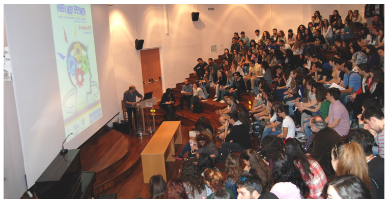
Στιγμιότυπο από διάλεξη στο Μουσείο κατά την Ημέρα του Νέου Ερευνητή.