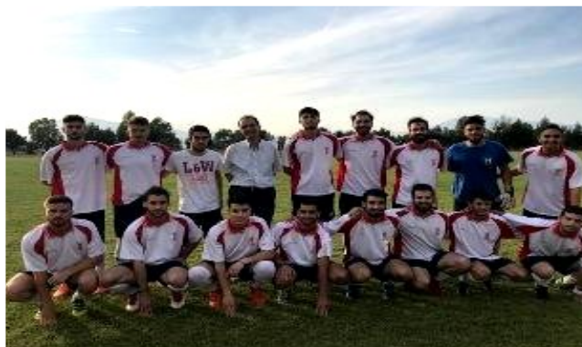
Η πρωταθλήτρια ποδοσφαίρου 2018: Μηχανικοί Η/Υ.