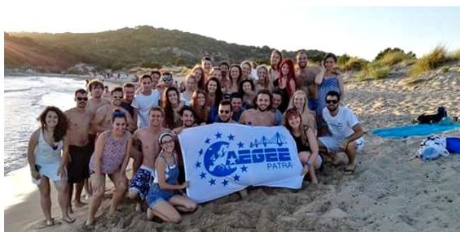
Στην παραλία της Βοϊδοκοιλιάς κατά τη διάρκεια του Summer University 2016.