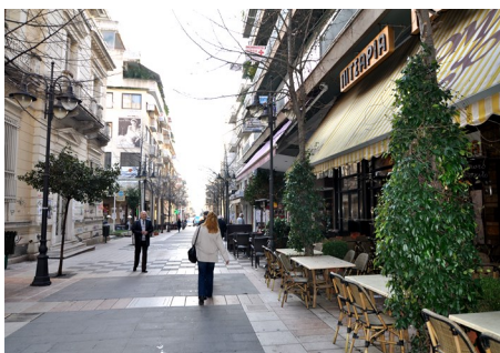
Ο πεζόδρομος της οδού Χαριλάου Τρικούπη στο Αγρίνιο

Το Αγρίνιο είναι η μεγαλύτερη πόλη του νομού Αιτωλοακαρνανίας, κτισμένη σε εύφορη πεδιάδα κοντά στις λίμνες Τριχωνίδα και Λυσιμαχεία. «Η πόλη του καπνού», όπως ονομάζεται, άκμασε στο μεσοπόλεμο, με την ανάπτυξη του εμπορίου των καπνών. Οι μεγάλες καπναποθήκες που κτίστηκαν τότε είναι τα τοπώσημα του Αγρινίου. Αποτελούν την αρχιτεκτονική κληρονομιά του, μαζί με όσα νεοκλασικά και κτήρια παραδοσιακής αρχιτεκτονικής διασώθηκαν. Η κεντρική περιοχή της πόλης αναπτύσσεται γύρω από την πλατεία Δημοκρατίας και τον άξονα βορρά-νότου που σχηματίζουν οι οδοί Παπαστράτου και Χαριλάου Τρικούπη, όπου συγκεντρώνονται το εμπόριο και οι δραστηριότητες αναψυχής και ελεύθερου χρόνου. Η κεντρική περιοχή είναι προσβάσιμη πεζή από τα κτήρια του Πανεπιστημίου. Το Αγρίνιο είναι έδρα του ΔΗΠΕΘΕ Αγρινίου και η πολιτιστική ζωή εξελίσσεται κυρίως στο Παπαστράτειο, τη Δημοτική Αγορά του μεσοπολέμου (τώρα πολυχώρο πολιτισμού), τη Δημοτική Πινακοθήκη και τη Γλυπτοθήκη Καπράλου. Η φοιτητική κοινότητα είναι πολύ δραστήρια, με θεατρική ομάδα που παρουσιάζει κάθε χρόνο αξιόλογη παράσταση, εκθέσεις και διαγωνισμούς φωτογραφίας, και άλλες δραστηριότητες.