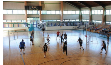
Το κλειστό γήπεδο με τα γήπεδα μπάσκετ και βόλεϊ, στο βάθος η αίθουσα με τα βάρη και κάτω το κολυμβητήριο του γυμναστηρίου.