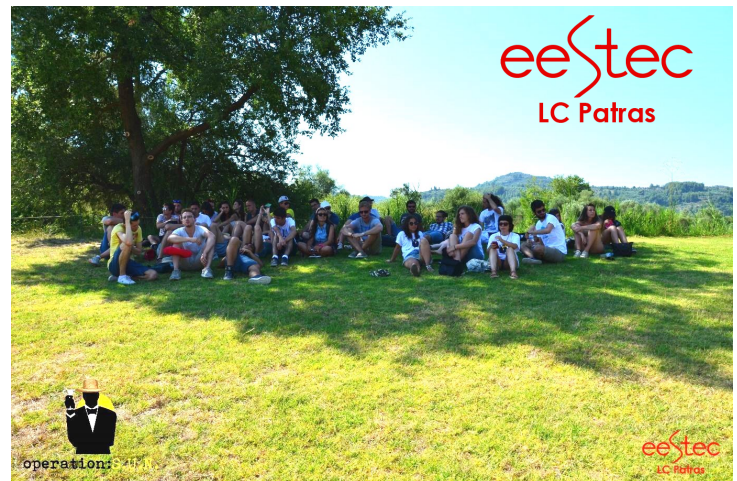
Οι συμμετέχοντες του καλοκαιρινού exchange «Operation: S.U.N.», του LC Patras