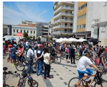
Το ποτάμι του Εύηνου, ιδανικό για αθλητικές δραστηριότητες όπως το κανόε-καγιάκ και το ράφινγκ (πάνω), kitesurf στο Δρέπανο και ποδηλατική βόλτα με αφετηρία την κεντρική πλατεία Γεωργίου (κάτω).