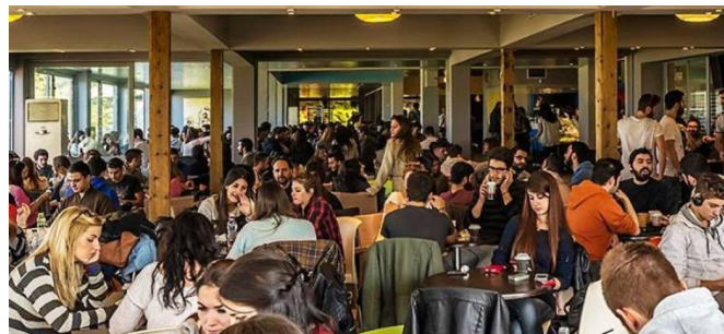
Το Πάρκο της Ειρήνης, το κεντρικό σημείο συνάντησης της Πανεπιστημιούπολης, κάποιες ώρες εξαιρετικά θορυβώδες. Τα καλοκαίρια, τραπεζάκια έξω με θέα τη γέφυρα.

Για ένα σάντουιτς ή έναν καφέ υπάρχει η λύση των κυλικείων (Ιατρικής, Θετικών Επιστημών, Πολιτικών Μηχανικών, Μηχανικών Υπολογιστών), της στάσης κοντά την Πρυτανεία που έχει επώνυμο καφέ στα όρθια, καθώς και του Πάρκου της Ειρήνης, του κεντρικού σημείου συνάντησης στο Πανεπιστήμιο. Για φαγητό υπάρχει η λύση του Πάρκου της Ειρήνης που έχει ένα φτηνό και καλό εστιατόριο: με 5 ευρώ μπορείτε να φάτε μαγειρευτό φαγητό, σχεδόν σαν στο σπίτι σας. Επίσης, υπάρχει η λύση του Εστιατορίου της Φοιτητικής Εστίας. Είναι ένα μεγάλο εστιατόριο όπου κάθε μέρα χιλιάδες φοιτητές παίρνουν πρωινό, μεσημεριανό ή ακόμη και βραδινό. Μάλιστα την Πέμπτη, τη μέρα που έχει το καλύτερο πιάτο της εβδομάδας, η αναμονή στην ουρά μπορεί να κρατήσει αρκετά. Εδώ όμως χρειάζεται εις να βγάλετε την κάρτα σίτισης, αν δικαιούστε, ή να αγοράσετε κουπόνια εβδομαδιαία από την Εστία. Το κόστος: στην πρώτη περίπτωση δωρεάν, στη δεύτερη 2 ευρώ τη μέρα. Ακόμη