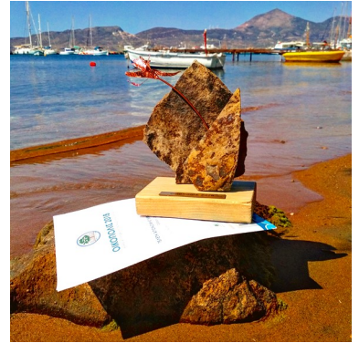
Το αγαλματίδιο «Οικόπολις 2018» που απονεμήθηκε στο Πανεπιστήμιο Πατρών.

Τα βραβεία περιβαλλοντικής ευαισθησίας ΟΙΚΟΠΟΛΙΣ είναι ένας θεσμός, ο οποίος έχει καθιερωθεί από το 2005, με σκοπό την αναγνώριση και επιβράβευση της περιβαλλοντικής ευαισθησίας και της συνεισφοράς Επιστημόνων, Οργανισμών, Φορέων, Επιχειρήσεων, και ΜΜΕ.