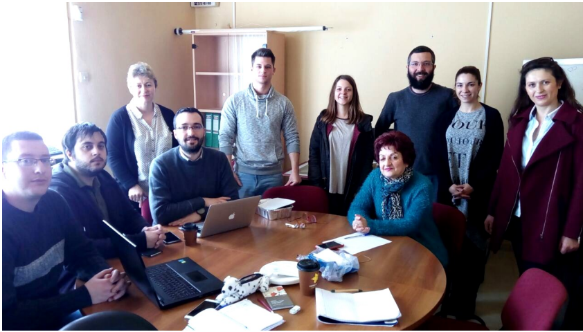
Από την επίσκεψη μελών του Πανεπιστημίου Αργυροκάστρου στο Τμήμα Φιλολογίας

Όπως μας απέδειξε η μέχρι σήμερα εμπειρία μας, η δυναμική της νέας αυτής πρόκλησης των ευρωπαϊκών χωρών διευρύνει την εξωστρέφεια και ενισχύει καθοριστικά την αναγνωρισιμότητα, το έργο και τις συνεργασίες των ανώτατων ιδρυμάτων, ενώ προσέφερε τη δυνατότητα σε διδάσκοντες και φοιτητές να μετάσχουν σε μια αυθεντική urbi et orbi διεθνοποίηση στα πεδία της πανεπιστημιακής μάθησης, της έρευνας και της ανάπτυξης δεξιοτήτων.