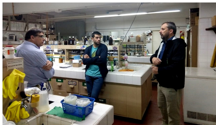
Από την επίσκεψη μελών ΔΕΠ του Πανεπιστημίου μας στη Λατινική Αμερική (Βραζιλία – Αργεντινή)

Το Πανεπιστήμιο Πατρών από την πρώτη στιγμή συμμετείχε δυναμικά στη δράση αυτή, έχοντας υποβάλει μέχρι σήμερα τρεις ιδρυματικές προτάσεις (calls 2015, 2016 και 2017). Με την ολοκλήρωση του δεύτερου κύκλου στις 31/5/2018, το Πανεπιστήμιό μας έχει πλέον αποκτήσει μια πολύτιμη διαχειριστική αλλά και ακαδημαϊκή εμπειρία. Τα τρία τελευταία χρόνια οι δραστηριότητές μας μέσω του Erasmus+ εξαπλώθηκαν σε 25 νέες χώρες, όπου είχαμε τη δυνατότητα να συνεργαστούμε με 57 Πανεπιστήμια στις εξής χώρες: Αλβανία, Αργεντινή, Αρμενία, Αυστραλία, Βραζιλία, Γεωργία, ΗΠΑ, Ιορδανία, Ισραήλ, Καζακστάν, Καναδάς, Κίνα, Μαρόκο, Μεξικό, Μοζαμβίκη, Μολδαβία, Μπρουνέι, Νιγηρία, Νότιο Αφρική, Ουκρανία, Πακιστάν, Ρωσία, Σερβία, Σιγκαπούρη και Τυνησία. Από και