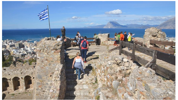
Επίσκεψη στο Κάστρο της πόλης μας