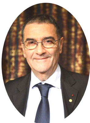
Ο Serge Haroche

Το 2014, Επίτιμος Διδάκτορας της Σχολής Θετικών Επιστημών αναγορεύτηκε ο Serge Haroche, ένας από τους πρωτοπόρους στην πειραματική μελέτη των κβαντικών φαινομένων.