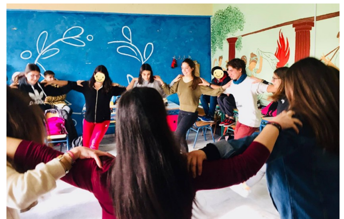
Μάθημα ελληνικών χορών