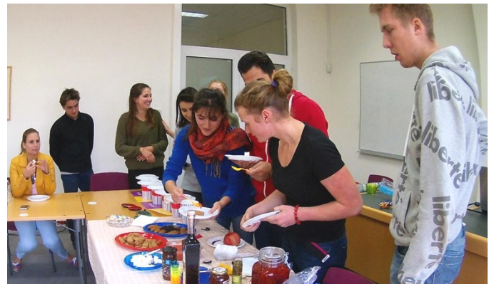
Οι φοιτητές δοκιμάζουν παραδοσιακά προϊόντα και γνωρίζουν τη μεσογειακή διατροφή