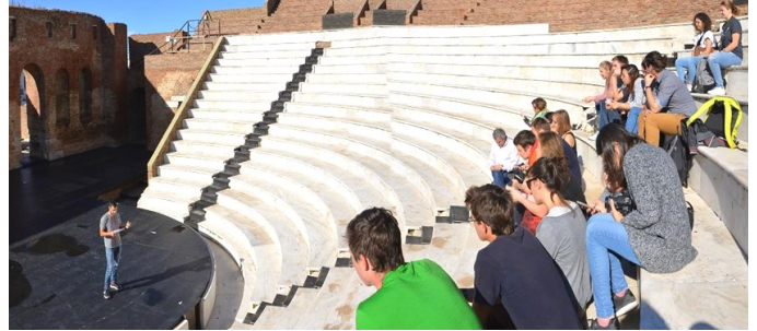
Από την επίσκεψη των φοιτητών στο Ρωμαϊκό Ωδείο της Πάτρας

[Άννα Ρούσσου και Ελένη Γεωργουδάκη, Εργαστήριο Ελληνικής Γλώσσας και Πολιτισμού]