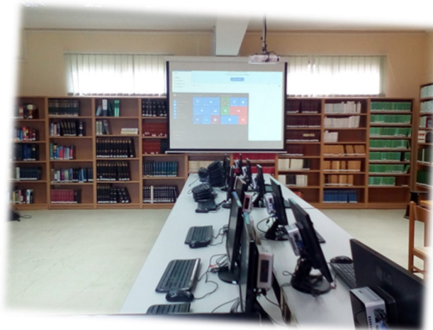
Το Κέντρο Ψηφιακής Έρευνας και Μελέτης του Τμήματος Φιλολογίας

Η Ειδικότητα Γλωσσολογίας συμμετέχει σε πολλά ερευνητικά προγράμματα, στοχεύοντας στην αριστεία, και σε πρωτοποριακά για την Ελλάδα ερευνητικά προϊόντα (όπως π.χ. ένα τριδιαλεκτικό ηλεκτρονικό λεξικό για τα Ποντιακά, τα Καππαδοκικά και τα Αϊβαλιώτικα, ένας ηλεκτρονικός διαλεκτικός άτλαντας για τη Λέσβο, ένα ψηφιακό μουσείο με αντικείμενο τον ελληνισμό της διασποράς). Επίσης, από το 2016 στο Τμήμα μας οργανώνεται θερινό σχολείο σε συνεργασία με το Πανεπιστήμιο του Οχίο, του οποίου φοιτητές έρχονται να μάθουν ελληνικά και να γνωρίσουν τον ελληνικό πολιτισμό στον τόπο του.