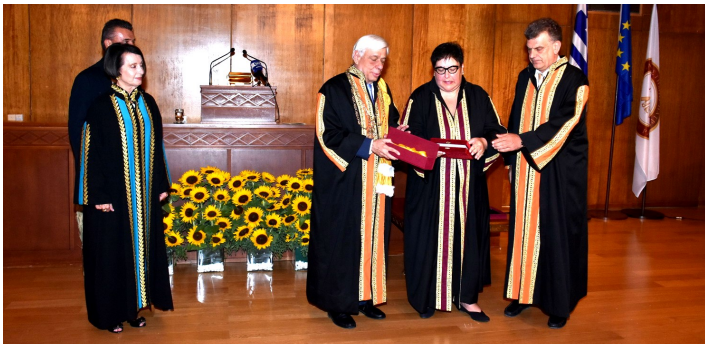
Αναγόρευση της Α.Ε. του Προέδρου της Ελληνικής Δημοκρατίας σε Επίτιμο Διδάκτορα της Σχολής Οργάνωσης και Διοίκησης Επιχειρήσεων, μετά από πρόταση του Τμήματος.

Συνέντευξη της Προέδρου Δώρας Μονιούδη-Γαβαλά