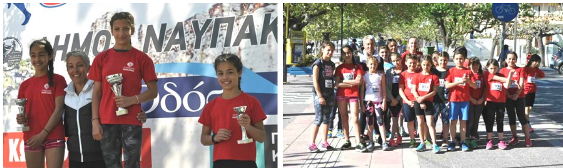
Το «χρώμα» των Ακαδημιών του Πανεπιστημίου είχε το βάθρο στην κατηγορία των κοριτσιών (3 πρώτες θέσεις) (αριστερά), Ομαδική φωτογραφία των μικρών αθλητών (δεξιά), πηγή: www.gym.upatras.gr

Μπορεί στο προηγούμενο τεύχος της εφημερίδας να αφιερώσαμε την αθλητική στήλη σε ένα άρθρο γενικότερου ενδιαφέροντος, αλλά οι εξελίξεις στο πλαίσιο του Πανεπιστημιακού Γυμναστηρίου συνεχίζουν να τρέχουν. Παραθέτουμε με τίτλους τις σημαντικότερες από αυτές στο διάστημα που μεσολάβησε.