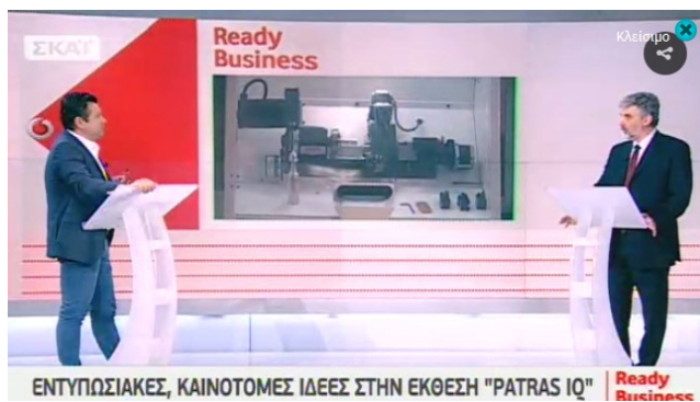
Η συνέντευξη του κ. Δημ. Πολύζου, Αν. Πρύτανης Έρευνας και Ανάπτυξης, στην εκπομπή του ΣΚΑΪ «Ready Business: Τα Νέα των Μικρομεσαίων Επιχειρήσεων» με τον Νίκο Υποφάντη, στις 7 Μαΐου 2017

Την εκδήλωση παρακολούθησε πλήθος κόσμου ενώ απηύθυναν χαιρετισμό ο πρώην Πρωθυπουργός, κ. Γιώργος Παπανδρέου, ο Αναπληρω-