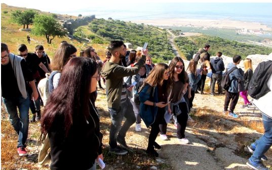
Εκπαιδευτική εκδρομή στην Πλευρώνα Αιτωλοακαρνανίας

Το Τμήμα, που έχει χαρακτηριστεί ως μη έχον αντιστοιχία, επιδιώκει σταθερά τις συνεργασίες και την εξωστρέφεια. Αναφέρω ενδεικτικά ότι έχει αναπτύξει συνέργειες με παροχή διδακτικού έργου από τους καθηγητές του σε άλλα Τμήματα του Πανεπιστημίου Πατρών (Ηλεκτρολόγων Μηχανικών & Τεχνολογίας Υπολογιστών, Φιλολογίας, ΤΕΕΑΠΗ), Τμήματα του Ε.Κ.Π.Α. και άλλων Α.Ε.Ι. Καθηγητές του πραγματοποιούν διαλέξεις ως προσκεκλημένοι ομιλητές σε Τμήματα Α.Ε.Ι., αναλαμβάνουν ερευνητικά προγράμματα σε συνεργασίες με καθηγητές άλλων Πανεπιστημιακών Τμημάτων και συμμετέχουν ενεργά σε μεγάλο αριθμό διεθνών συνεδρίων με στόχο την περαιτέρω ανάπτυξη συνεργασιών με τη διεθνή πανεπιστημιακή κοινότητα. Έχει υπογράψει και υλοποιεί συμφωνίες ERASMUS (με Πανεπιστήμια Κροατίας και Κύπρου) και συμφωνίες ακαδημαϊκής συνεργασίας με Πανεπιστήμια του εξωτερικού και καταξιωμένους επιστημονικούς φορείς. Συνεχίζει την ανασκαφή στο Άργος Ορεστικό, μαζί με το Τμήμα Ιστορίας και Αρχαιολογίας του Ε.Κ.Π.Α.