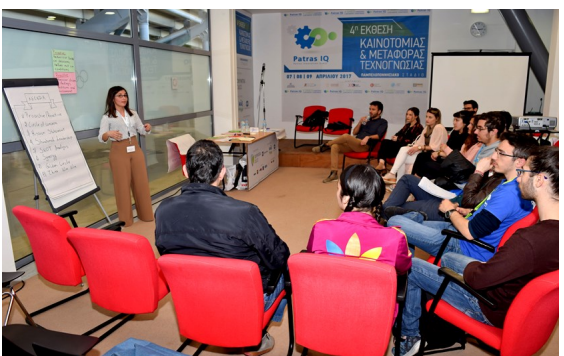
«Soft Skills Training»: ένα μέρος από την σειρά των workshops που διοργάνωσαν οι φοιτητικές επιστημονικές ομάδες.

startuper» από τον «Comvos –Επιστημονικές Φοιτητικές Ομάδες του ΠΠ».