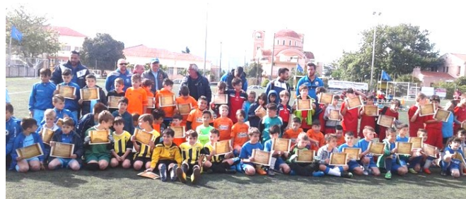
Οι μικροί ποδοσφαιριστές με τα αναμνηστικά που τους απονεμήθηκαν στο Πασχαλινό τουρνουά, πηγή: www.gym.upatras.gr

Τ έλος, στα μέσα Ιουνίου 2017 θα διοργανωθεί από το Παν. Γυμναστήριο τουρνουά Ποδοσφαίρου με συμμετοχή των Ακαδημιών του αλλά και άλλων ομάδων της πόλης με αφορμή τη λήξη της προπονητικής περιόδου, στο πλαίσιο του διημέρου της 5ης Γιορτής Αθλητικών Ακαδημιών 2017 του Πανεπιστημίου.