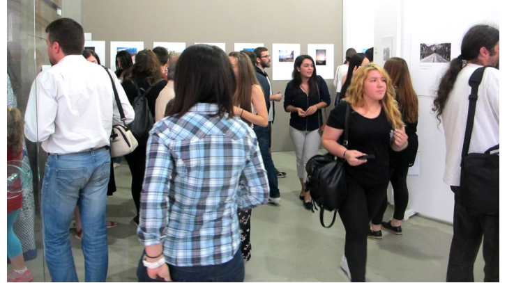
Έκθεση φωτογραφίας στη Δημοτική Αγορά Αγρινίου, μετά από διαγωνισμό που οργάνωσε το Τμήμα.