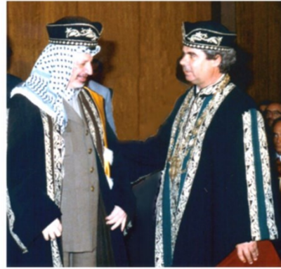
Ο Γ. Αραφάτ με τον Πρύτανη Σ. Αλαχιώτη, κατά την τιμητική εκδήλωση αναγόρευσης του σε επίτιμο διδάκτορα, Μάιος 1996

Η Ευρώπη, τα τελευταία χρόνια, με το νέο κύμα συρράξεων και αναταραχών στη Μέση Ανατολή, είναι παρατηρητής στον ισλαμικό φονταμελισμό και την τρομοκρατία που τον συνοδεύει. Χιλιάδες πρόσφυγες συρρέουν προς τις χώρες της Μεσογείου και της Ευρώπης, ελπίζοντας για την επιβίωση τους, για ένα πιο ελπιδοφόρο μέλλον. Οι υπό συγκρούσεις χώρες «σπαράζουν» από τις παρατεταμένες εχθροπραξίες και διαπραγματεύσεις τον τελευταίο αιώνα. Καθοριστικό ρόλο στη διευθέτηση και επίλυση του μεσανατολικού ζητήματος, έπαιξε ο ηγέτης της Παλαιστινιακής Αρχής, Γιασέρ Αραφάτ. Ο Γιασέρ Αραφάτ, το Μάιο του '96 ανακηρύχθηκε Επίτιμος Διδάκτορας του τμήματος Οικονομικών επιστημών του Πανεπιστημίου Πατρών. Το 1994, είχε τιμηθεί από την παγκόσμια κοινότητα με το βραβείο «Νόμπελ Ειρήνης».