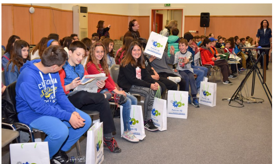
Από την επίσκεψη των μαθητών στην έκθεση