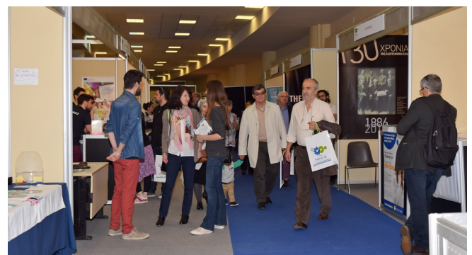
Ο χώρος της έκθεσης