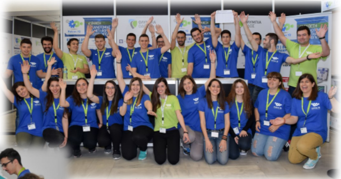
Στιγμές από την έκθεση με πρωταγωνιστές τους εθελοντές της έκθεσης. Με πράσινα μπλουζάκια εμφανίζονται οι συντονιστές των εθελοντών.

Η βοήθεια που παρέιχαν στους εκθέτες, τους επισκέπτες και στους διοργανωτές σε καθημερινή βάση αποτελεί αναμφισβήτητο σημείο αναφοράς για την ανάληψη και την διεκπεραίωση τέτοιων μεγάλων γεγονότων. Χωρίς την βοήθεια των εθελοντών, η έκθεση δεν θα ήταν βιώσιμη και δεν θα μπορούσε να αντεπεξέλθει στην μεγάλη προσέλευση των επισκεπτών που την τίμησαν με την παρουσία τους.