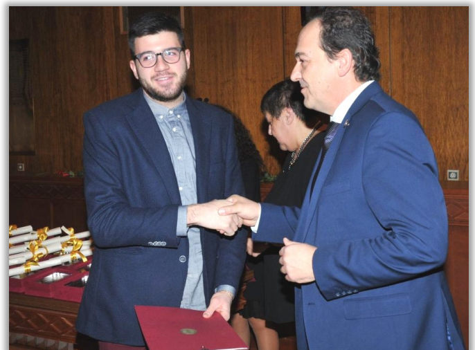
Βράβευση αριστούχου φοιτητή