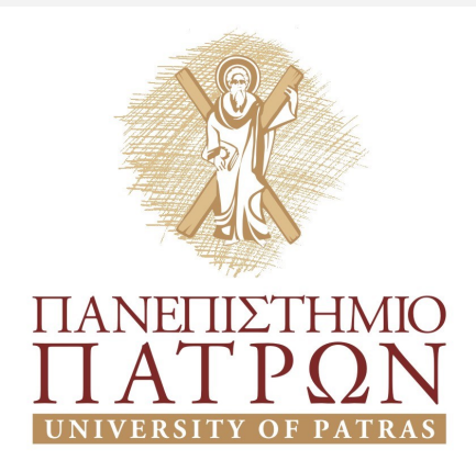
Το παλαιότερο λογότυπο

ται η χρήση της σφραγίδας). Αντίθετα το λογότυπο, διατηρώντας το έμβλημα του Πανεπιστημίου (Άγιος Ανδρέας) είχε ως στόχο με το λεκτικό μέρος να προβάλλει το όνομα του Πανεπιστημίου, όπως συνηθίζεται στις σύγχρονες εφαρμογές λογότυπων σε πολλά Ευρωπαϊκά Πανεπιστήμια. Η ολοκλήρωση της εταιρικής ταυτότητας του Πανεπιστημίου από την προηγούμενη