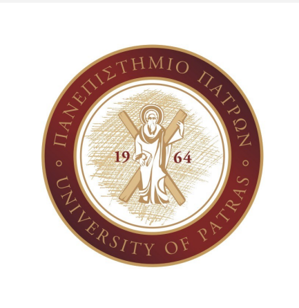
Το νέο λογότυπο του Πανεπιστημίου μας

Στο πλαίσιο αυτό και σύμφωνα με την τότε απόφαση της Συγκλήτου και τις οδηγίες του εγχειριδίου χρήσης, η σφραγίδα, ως τέτοια και όχι ως λογότυπο, είχε περιορισμένη χρήση (σε πτυχία, επίσημες συμφωνίες και τα σχετικά, όπου δηλαδή επιβάλλε-