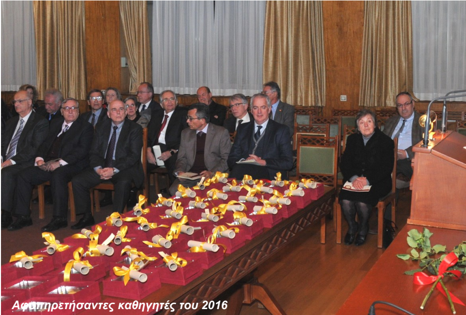
Αφυπηρέτησαντες καθηγητές του 2016