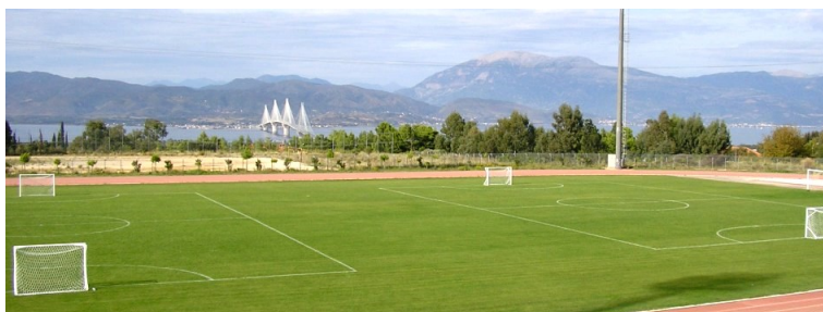
Το γήπεδο ποδοσφαίρου, με θέα τη γέφυρα του Ρίου

Πιο συγκεκριμένα, το γήπεδο του μπάσκετ που νοικιάζεται επί πληρωμή σε ομάδες της Πάτρας, παρά το γεγονός ότι φέρνει κάποια