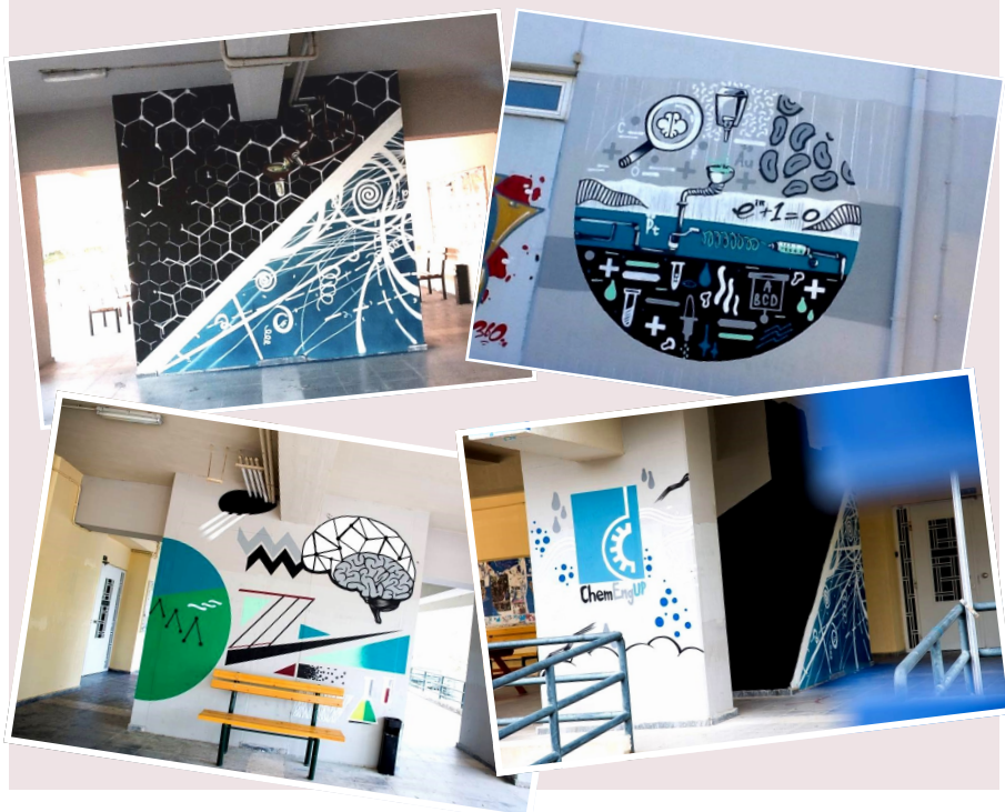
Φωτογραφίες από την Bonelli Arte

Εδώ και δύο μήνες περίπου, μερικά νέα γκράφιτι κοσμούν το κεντρικό και το νέο κτήριο του Τμήματος Χημικών Μηχανικών Πάτρας. Αξίζει να σημειωθεί ότι πριν ζωγραφιστούν τα όμορφα αυτά γκράφιτι, ήταν σύνηθες φαινόμενο οι τοίχοι αυτοί να βανδαλίζονται από εξωφοιτητικούς παράγοντες. Τώρα όμως που με πρωτοβουλία φοιτητών και Τμήματος πραγματοποιήθηκε αυτό το έργο, φαίνεται όλοι να το έχουν αγκαλιάσει.