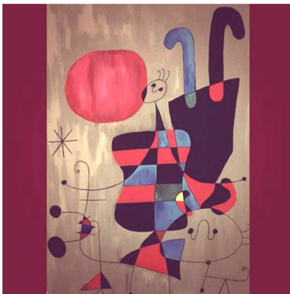
Οι αναγνώστες μας δημιουργούν

Τ ο δραστήριο και συνεχώς αναπτυσσόμενο Δημοτικό Περιφερειακό Θέατρο Πατρών, στην προσπάθειά του να συσφίξει τις σχέσεις του με το Πανεπιστήμιο και την κοινότητά του, έδωσε τη δυνατότητα σε φοιτητές να παρακολουθήσουν την τελευταία θεατρική παραγωγή του "Effect - Τομογραφία του έρωτα", ένα συγκινητικό, αστειό και απρόσμενα ανθρώπινο επιστημονικό θρίλερ, με το χαμηλό εισιτήριο 5 ευρώ για 2 εβδομάδες τον Ιανουάριο. Η ανταπόκριση των φοιτητών ήταν πολύ μεγάλη. Χαρακτηριστικό είναι ότι το θέατρο την εβδομάδα εκείνη είχε πληρότητα 100%. Το έργο ανεβαίνει στο Θέατρο Απόλλων (Πλ. Γεωργίου) μέχρι τις 8 Φεβρουαρίου.