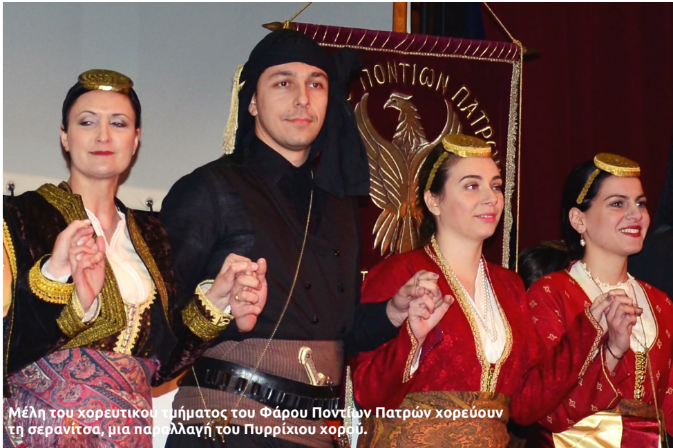
Μέλη του χορευτικού τμήματος του Φάρου Ποντίων Πατρών χορεύουν τη σερανίτσα, μια παραλλαγή του Πυρρίχιου χορού.