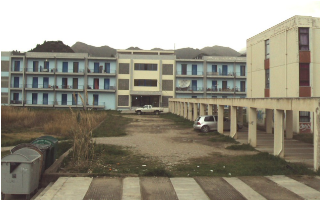
Η Φοιτητική Εστία Πατρών

Έφτασα στην πόρτα και, πριν την κλείσω, κοίταξα πίσω. Οι φωτογραφίες, ο καθρέφτης, η κουζίνα, το ψυγείο και το τεράστιο ροζ πουφ που έκλινε την είσοδο, δεν ήταν πια εκεί. Υπήρχε μόνο ένα άδειο, απρόσωπο δωμάτιο, ακριβώς όπως τότε, τον Δεκέμβριο του 2008 που το πρωτοαντίκρισα. Η μόνη διαφορά, τα συναισθήματά μου: μόλις είχε κλείσει