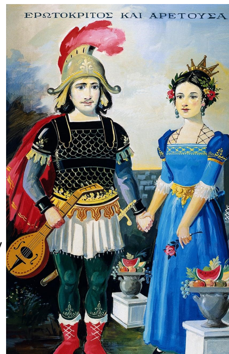
Ο Ερωτόκριτος και η Αρετούσα του Μποστ [λεπτομέρεια]