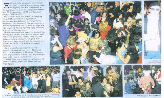
Εικόνες από τον 1ο αποκριάτικο χορό του Πανεπιστημίου Πατρών.