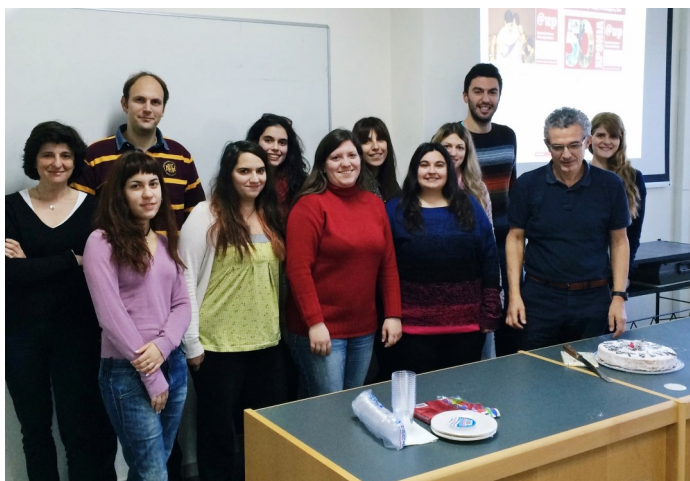
Η συντακτική ομάδα του @UP

Με ειδικό κομμάτι αφιερωμένο στον αναγνώστη του περιοδικού μας, τα μέλη της συντακτικής ομάδας του @UP, την Πέμπτη 15 Ιανουαρίου, έκοψαν πρωτοχρονιάτικη πίτα, στο πλαίσιο της μηνιαίας συνάντησης προετοιμασίας του επόμενου τεύχους.