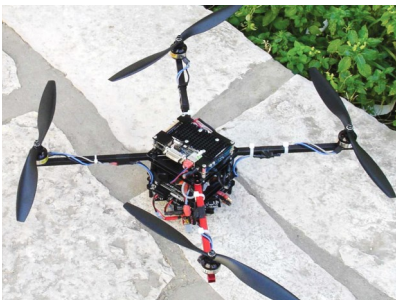
Το ερευνητικό πρωτότυπο UPATcopter που παρουσιάζεται στη διακριθείσα εργασία

Alexis, K., Nikolakopoulos, G., Tzes, A.: 'Model predictive quadrotor control: attitude, altitude and position experimental studies', IET Control Theory and Applications, 2012, 6, (12), pp. 1812-1827.