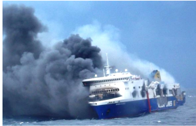
Το οχηματαγωγό Norman Atlantic φλεγόμενο

«Ξυπνήσαμε στην καμπίνα μας, όταν δόθηκε το σήμα συναγερμού γύρω στις 04:30 τα ξημερώματα. Ντυθήκαμε βιαστικά και κατευθυνθήκαμε στον πλησιέστερο σταθμό συγκέντρωσης. Εκεί επικρατούσε απερίγραπτη σύγχυση και πανικός, βασικά διότι δεν υπήρχε εκπαιδευμένο πλήρωμα για να καθοδηγεί τους επιβάτες. Εν τω μεταξύ η φωτιά έφτασε στο επίπεδο που ήταν οι σταθμοί συγκέντρωσης και έτσι η πλειονότητα των επιβατών ανέβηκε στο επίπεδο της γέφυρας και του καταστρώματος. Λόγω της έντονης θαλασσοταραχής γρήγορα αντιληφθήκαμε ότι η εκ θαλάσσης εκκένωση του πλοίου ήταν αδύνατη και έτσι η μόνη οδός σωτηρίας ήταν η εναέριος, με ελικόπτερα, η προσέλευση των οποίων, όμως, άρχισε τις με-